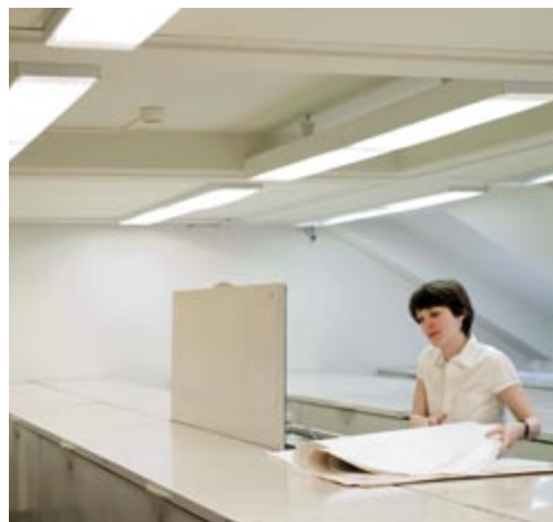
Die HV setzt sich für die technischen und administrativen Mitarbeitenden der ETH ein.