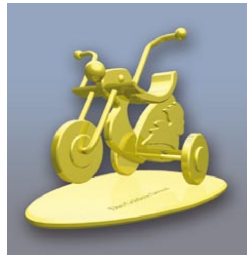
Das «goldene Dreirad», der ETH-Preis für familienfreundliche Vorgesetzte.