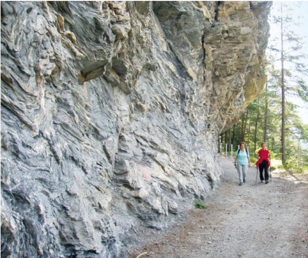
Der in den Felsen gehauene alte Weg über der Schynschlucht.