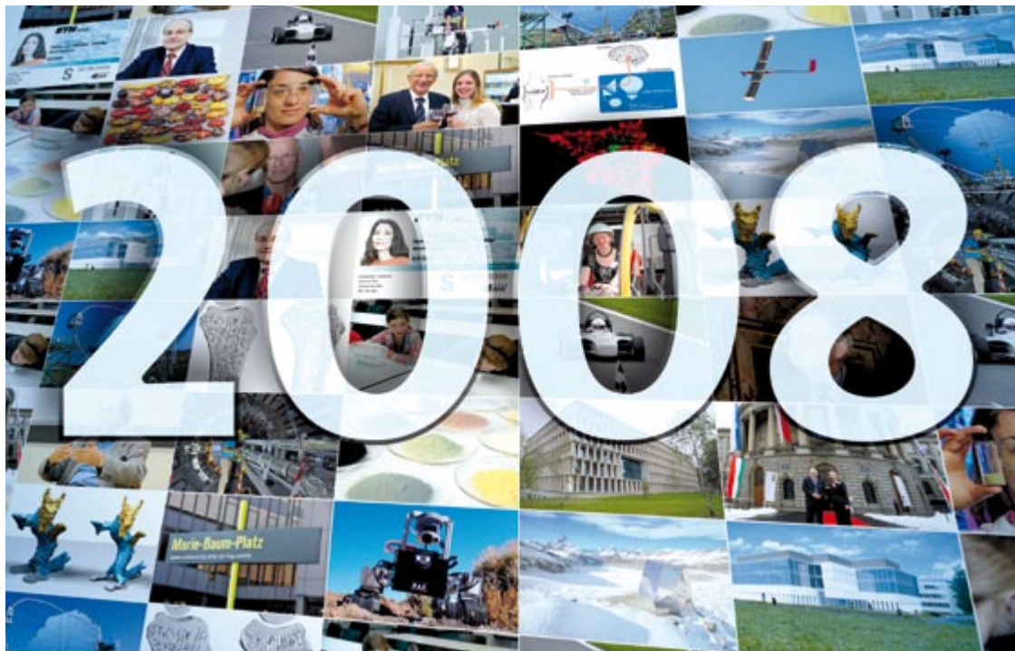
2008 war für die ETH Zürich ein erfolgreiches Jahr – trotz der weltweiten Finanzkrise.