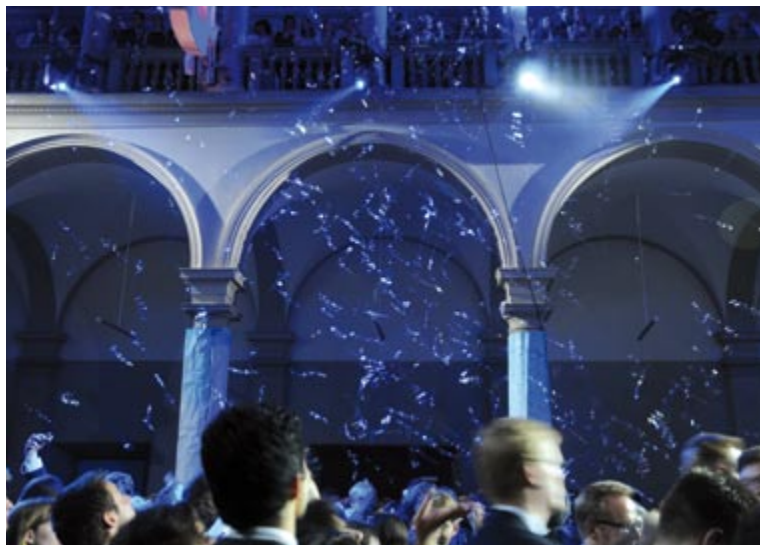
Am Polyball wurde das Hauptgebäude zum kochenden Eispalast.

So blieb es bei den warm eingepackten Skifahrerattrappen auf dem Kuppeldach der ETH, die sich den eintreffenden Ballgästen in eleganten Schwüngen entgegenzustürzen schienen, und bei der Balleröffnung durch die Flying Tabs im Wintersportoutfit, komplett mit Winterjacke, Mütze, Schal und Handschuhen. Dass sich die Tanzgruppe nach der ersten Nummer auf offener Bühne stilvoll aus den Winterklamotten schälte, um im leichten Tanzdress weiterzusteppen, war nur allzu verständlich, denn bereits zu diesem Zeitpunkt begann sich die Atmosphäre im Eispalast merklich zu erwärmen.